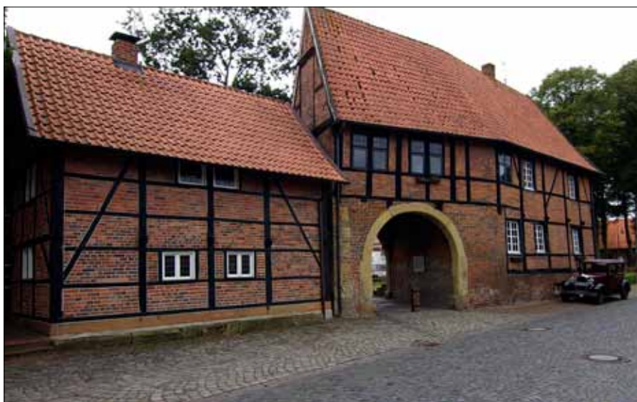
Die Hunnenporte in Asbeck diente als Zwinger für die Jagdhunde

Auf unserer Wanderung Richtung Asbeck, seit 1969 Ortsteil der Gemeinde Legden, überqueren wir den Legdener Mühlenbach, der sich hier zumindest östlich des Weges von seiner naturnahen Ausprägung präsentiert. Besonders markant sind die Steilufer an den Prallhängen, die stellenweise vier Meter hoch sind. Am Bach selbst wachsen Sumpf-Vergissmeinnicht, Bachbunge, Sumpfhornkraut und das Rohrglanzgras. Auf seinen Blättern nimmt gerne die Gebänderte Prachtlibelle Platz, um wahlweise nach Beute oder einem passenden Partner Ausschau zu halten. Die