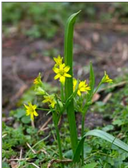
Der Gelbsterne blüht am Hanseller Bach

Auf kleinen Pättkes geht es entlang des Hanseller Baches. Im zeitigen Frühjahr blühen hier überall Schneeglöckchen, ab und an mischt sich auch der seltene Gelbsterne dazwischen. Kurz danach erscheinen zunächst die rötlichen Blütenstände der Pestwurz, und dann dauert es nicht mehr lange, bis die riesigen Blätter der Pflanze der Blütenpracht ein Ende setzen. Es geht auf die Bauerschaft Hansell zu. Dabei verfehlen wir nur knapp eine rund 300 Jahre alte Windmühle, genauer gesagt eine Holzholländeracht-eckwindmühle auf gemauertem Untergeschoss, die sich seit einiger Zeit aber flügelahm präsentiert.