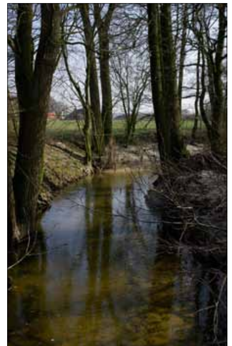
Die Vechte: Heimat der Groppe

Für eine stilvolle Stärkung bietet sich ein Bauerncafé an, das in dem rund 300 Jahre alten denkmalgeschützten Torhaus des ehemaligen Hofes Ruck untergebracht ist. Kurz danach überqueren wir eine Bahnlinie, auf der 1984 der letzte Zug verkehrte. Auf der Strecke zwischen Rheine und Billerbeck schnaufen statt Dampflok zukünftig Radfahrer, denn aus dem Schienenweg wird sukzessive ein Fahrradweg. Nicht weit von der Brücke befindet sich vor Horstmar in einem tiefen Einschnitt der