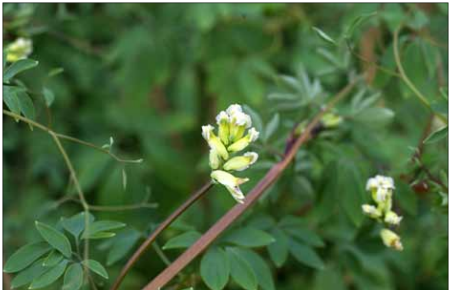
Der rankende Lerchensporn stellt an seinem Standort Botaniker vor Rätsel

Die gestalterische Kraft der Ems wird erneut deutlich in den Bockholter Bergen. Schließlich war es der Fluss, der am Ende der letzten Kaltzeit den Sand hierher verfrachtete, den der Wind anschließend