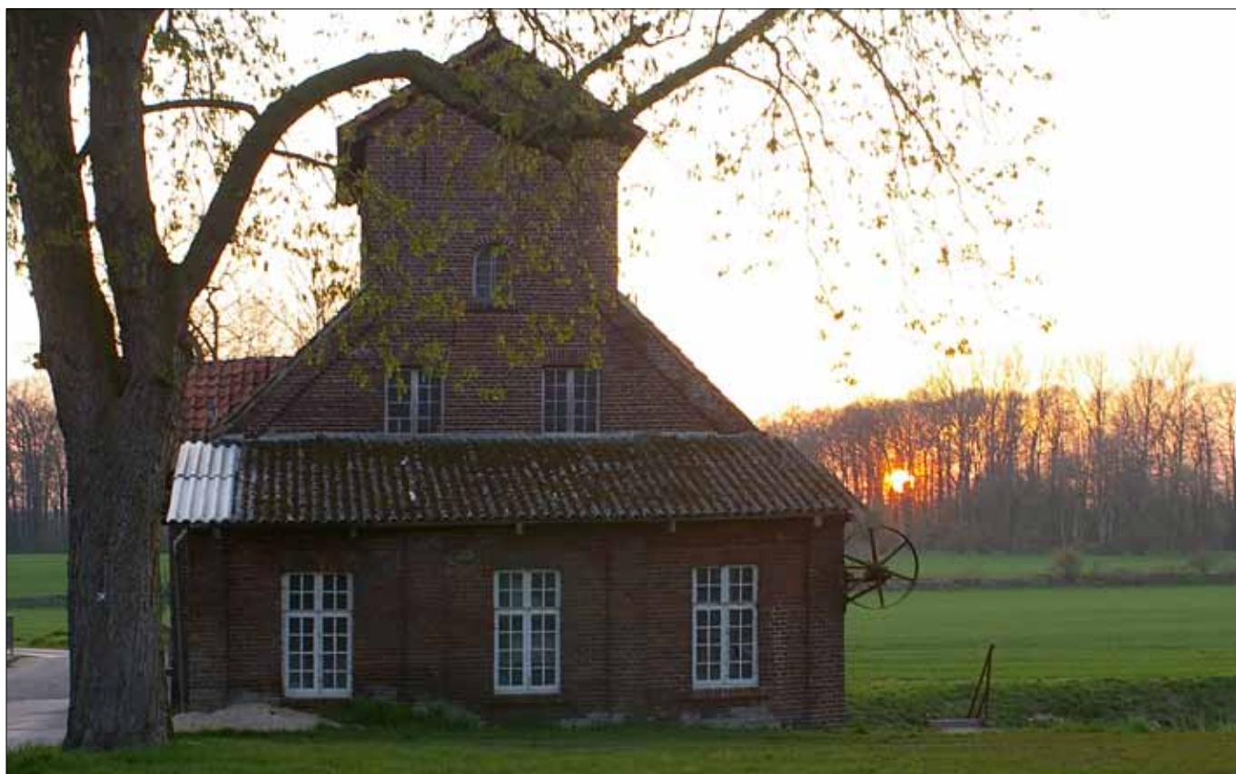
Die Mühle Schulze-Pellengahr steht an einem über drei Meter hohen Sohlabsturz

Frühsommer ist der Laubfrosch zu hören, dessen Bestand aber abgenommen hat, weil das Gebiet zu isoliert ist. Dann blüht auch das Breitblättrige Knabenkraut in den Wiesen, die der Botaniker als Streuwiesen bezeichnet. Sie haben sich dort entwickelt, wo es lange Zeit nass war und der Bauer erst spät mähen konnte – so spät, dass das Heu kaum noch Futterwert hatte und als Einstreu in die Ställe kam.