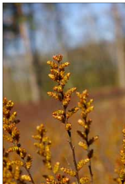
Gagel wächst in der Bröcke

Wir überqueren die A 31, den „Ostfriesenspieß“, und nähern uns Haus Egelborg. Vorher geht es erneut durch einen von schönen alten Buchen und Eichen