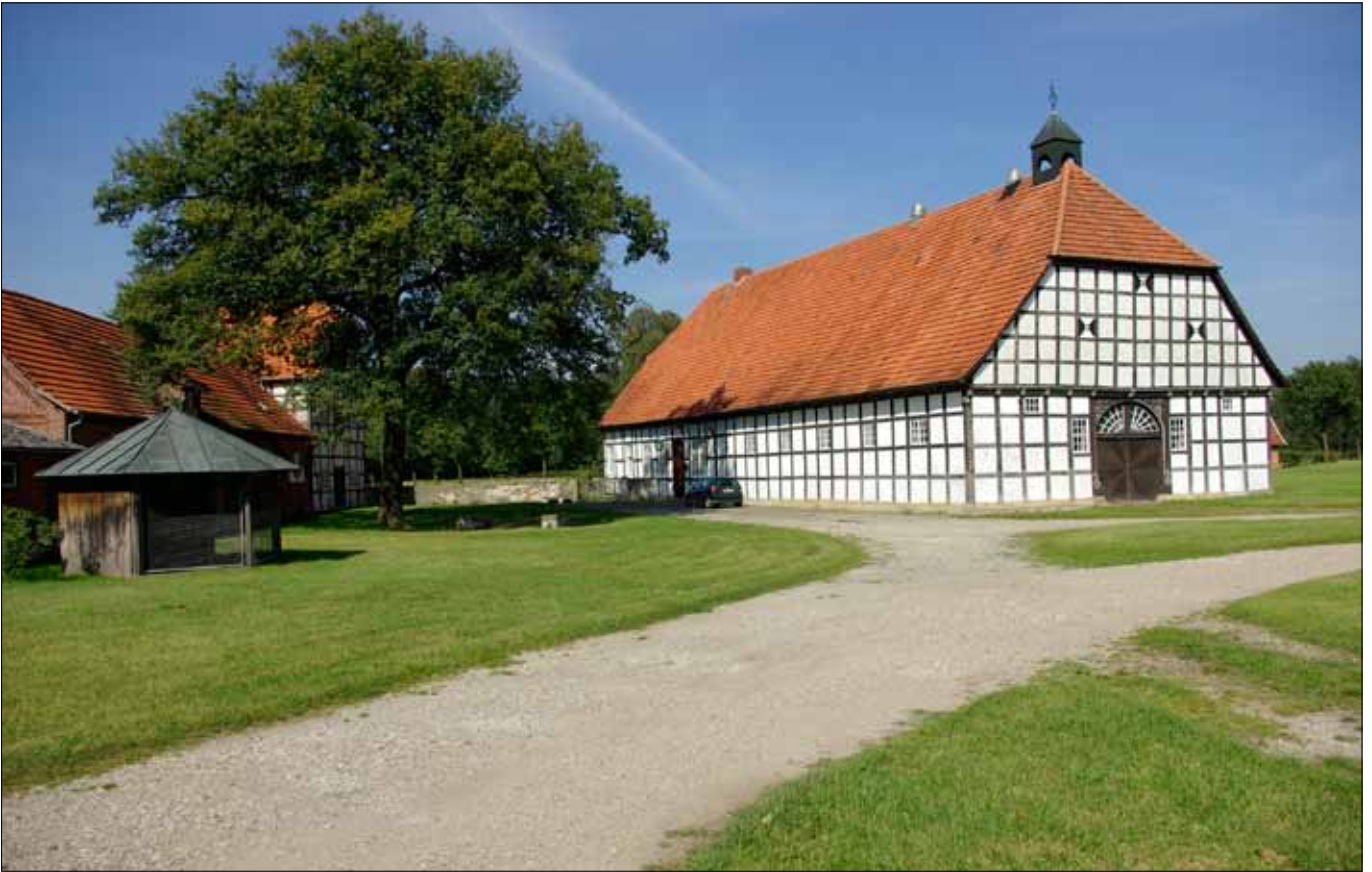
Hof bei Glandorf, bereits 1120 zum ersten Mal urkundlich erwähnt

nützt nichts: Vom Moor ist weit und breit keine Spur. Lediglich inmitten eines Kiefernbestandes erinnert ein kleiner Rest einer Feuchtheide, der im Frühjahr durch das fruchtende Wollgras und im Sommer durch die blühende Glockenheide auffällt, an das ehemalige Landschaftsbild. Wahrscheinlich dürfte es sich eher um ein Niedermoor mit höchstens einem kleinen Hochmoorkern gehandelt haben. Die bäuerlichen Torfstiche konzentrierten sich um die heutige „Moorsiedlung“, die aber zu einer Zeit entstand, als das Moor längst entwässert und in Grünland umgewandelt worden war.