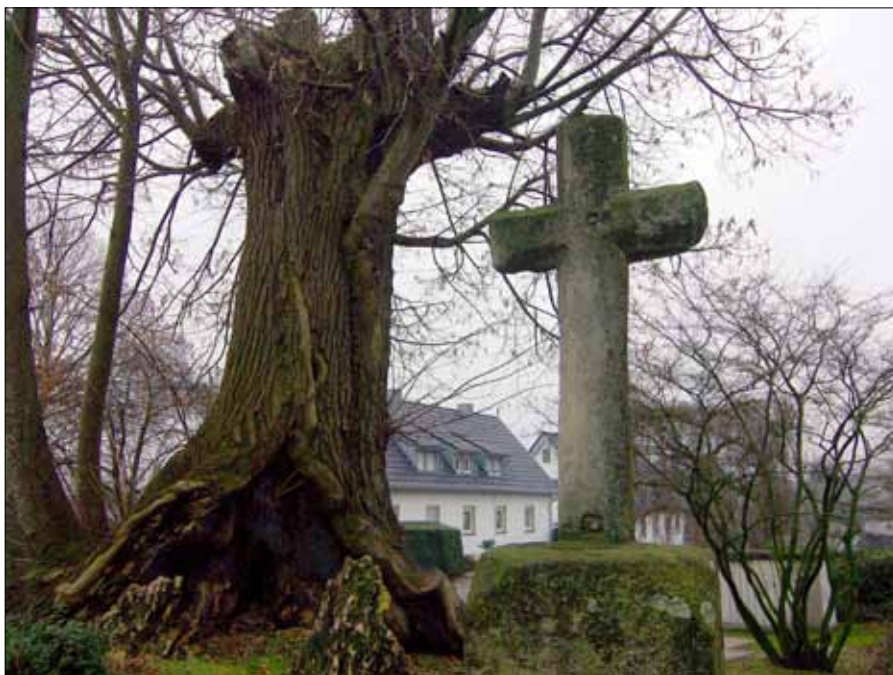
Das Heidenkrüs von Laer steht neben dem Heidenbaum

Wir bleiben bei Zeugen der Vergangenheit, von denen Laer einige aufzuweisen hat, was auf eine gewisse Bedeutung des Ortes in früherer Zeit hindeutet. Nachdem wir weitere Steinkreuze passiert haben, treffen wir am Ortsrand auf das wohl bekannteste: Das „Heidenkrüs“ von Laer steht unter dem „Heidenbaum“, einer alten Linde, die 1990 durch einen Sturm ihrer Krone beraubt wurde. Unter der mächtigen Linde tagte einst das Freigericht „tho Lair ton seyven lynden“.