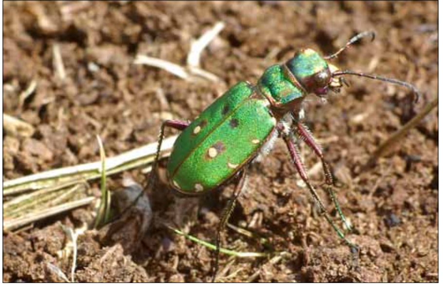
Der Sandlaufkäfer fühlt sich in den Bockholter Bergen wohl

Nach wie vor Ackerland ist der Niederesch, der sich kurz darauf linker Hand erstreckt. Er ist einer der beiden großen Eschfluren, die bei der Entstehung des Dorfes Gimfte eine wichtige Rolle spielten. Gimfte gehört zu den typischen Drubbelsiedlungen im Münsterland. Drubbel und Esch bildeten eine enge Verbindung. Im Zentrum der fruchtbaren Eschfluren siedelten sich die Bauernhöfe in kleinen Gruppen an. Ende