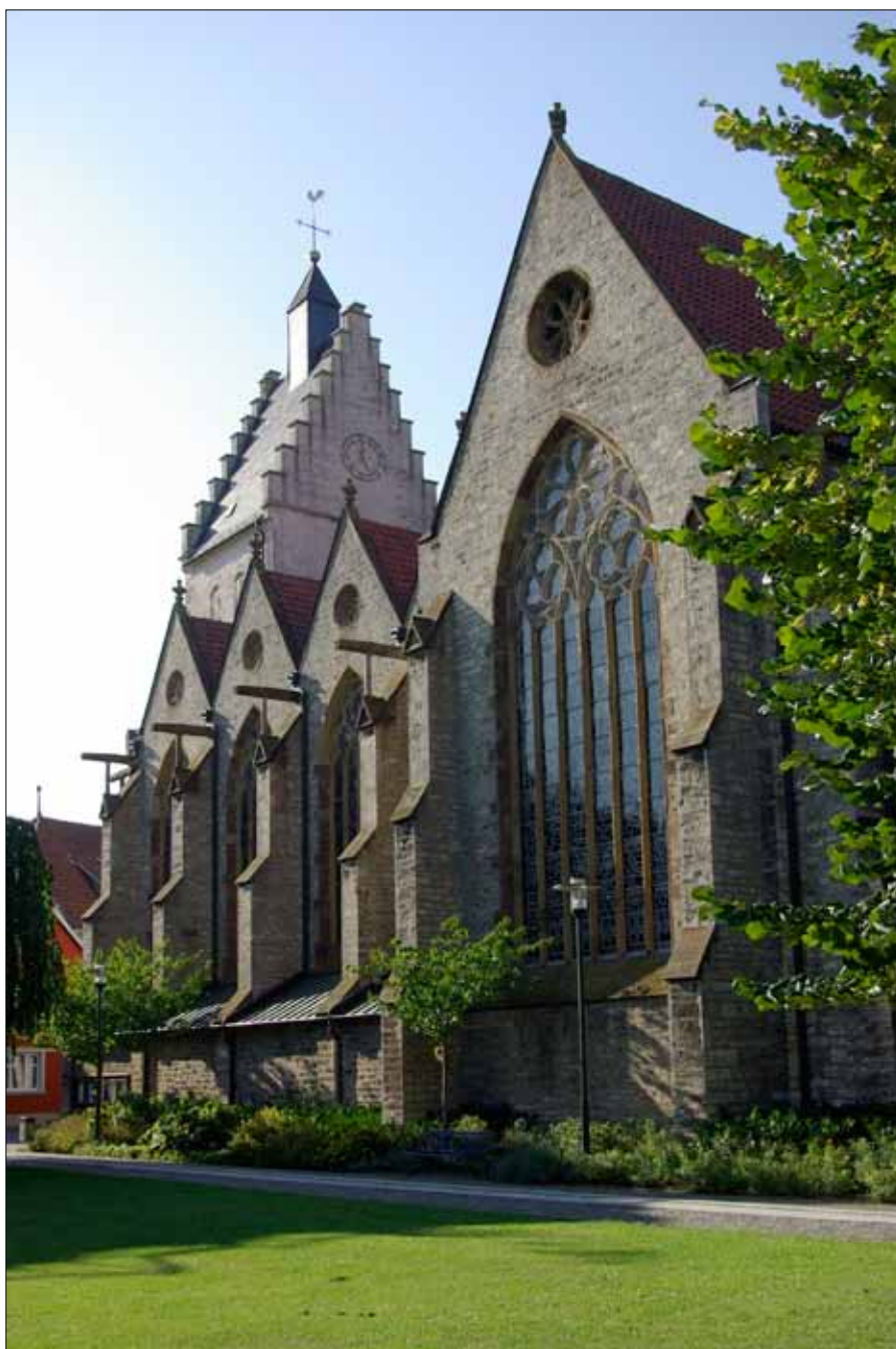
Die Kirche St. Marien in Bad Laer ist bekannt durch den Treppengiebel

In der Laerheide geht es sandig zu. Nur wenige hundert Meter südlich des Wanderweges wird Sand und Kies im großen Stil abgebaut. Die Gruben haben sich mit Wasser gefüllt und bieten als „Heideseen“ im Sommer nicht ganz ungefährliche und deshalb verbotene Badefreuden.