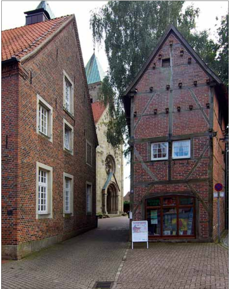
Der Ortskern von Legden bildet ein harmonisches Ensemble

Bevor wir Legden erreichen, überqueren wir die Bahnlinie zwischen Dortmund und Enschede, deren Bau 1874 in die Wege geleitet wurde. Warum, das verrät die Präambel des am 13. November 1874 unterzeichneten Vertrages: „Seine Majestät der Deutsche Kaiser, König von Preußen, im Namen des Deutschen Reichs, und Seine Majestät der König der Niederlande, von dem Wunsche beseelt, dem Handel und dem Verkehr beider Länder Vortheile zu verschaffen, welche aus der Herstellung einer von Dortmund über Gronau nach Enschede führenden Eisenbahnverbindung hervorgehen können, haben Bevollmächtigte ernannt, um zu diesem Zwecke eine Uebereinkunft abzuschließen ...“ Ganz so bedeutend, wie die Majestäten es sich damals vorstellten, ist die mittlerweile zur Nebenstrecke degradierte Bahnlinie zwar nicht mehr, aber immerhin ist sie von der Stilllegung