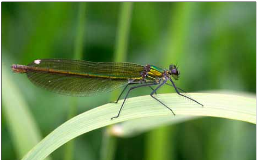
Prachtlibellen sind am Legdener Mühlenbach zu bewundern