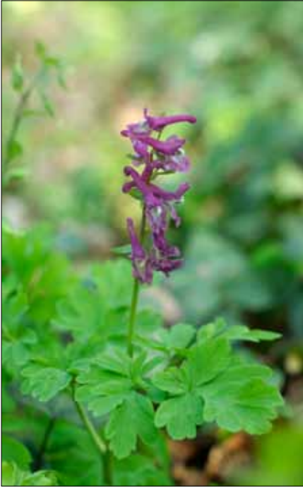
Lerchensporn im Blomberg

steinierungen von Schilf und Großseggen gaben wegen ihrer pfeifenartigen Struktur dem Gestein den Namen „Piepstein“ (Pfeifenstein). Südlich des Dorfes unterhielten Bauern bis in das 20. Jahrhundert eigene kleine Steinbrüche, sogenannte „Brauken“, um sich mit dem als Baumaterial begehrten Piepstein zu versorgen.